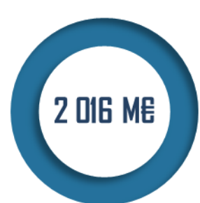
Crédits demandés PLF 2022 (en CP)