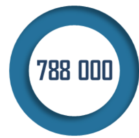
Participants aux JDC attendus en 2022

Les moyens alloués à la JDC par le programme 169 s'élèvent à 20,36 millions d'euros pour 2022, soit une augmentation de 2,54 millions d'euros, qui permettra principalement de prendre en compte la revalorisation de l'indemnité de déplacement versée aux participants. Ces crédits ne financent toutefois que les dépenses dédiées à la préparation et à l'organisation des journées , le reste des moyens étant issus de la mission « Défense » du budget de l'État, ce qui n'est pas source d'une parfaite lisibilité des crédits budgétaires consacrés à ce dispositif.