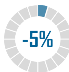
Diminution annuelle du nombre de pensionnés

En conséquence, les moyens consacrés à la gestion des droits liés aux pensions militaires d'invalidité , qui permettent de financer certains soins médicaux, des réductions tarifaires pour les transports et le régime de sécurité sociale des pensionnés de guerre, diminueraient de 0,9 million d'euros pour s'établir à 116,3 millions d'euros en 2022.