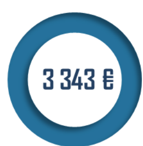
Montant moyen annuel de pension en 2020 (pensionnés directs)