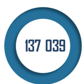
Nombre de pensionnés au 31 décembre 2020